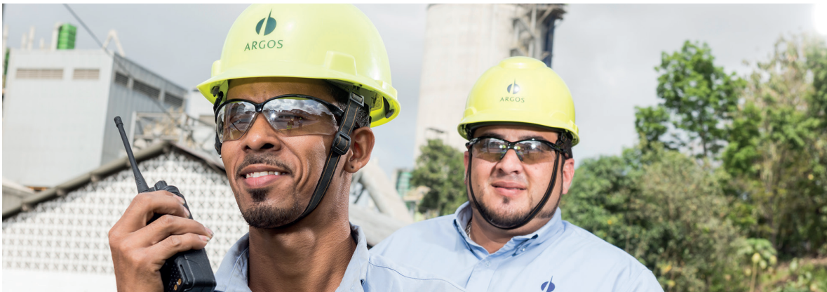
Colaboradores en la Planta Panamá, Regional Caribe y Centroamérica