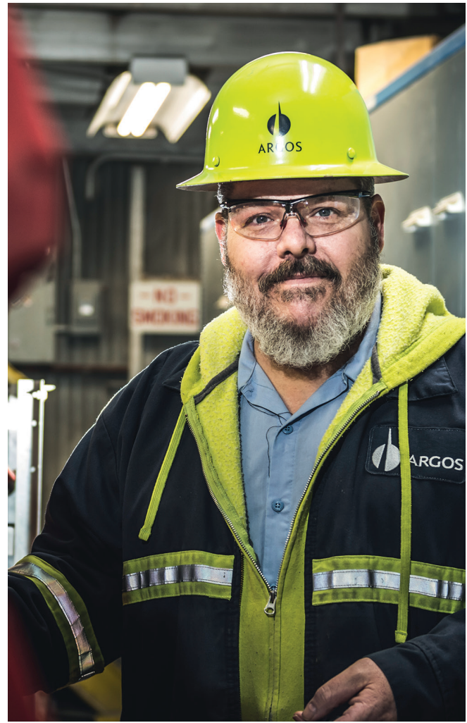
Colaborador en la Planta Roberta, Regional Estados Unidos

A-R11 A-R12 Vaya a la lista completa de riesgos estratégicos y emergentes en: http://reporteintegrado.argos.co/our-purpose/riesgosestrategicosyemergentes.pdf